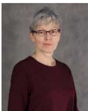
Председатель МС Суркова ОЕ

Добрый день, уважаемые коллеги! На сегодняшнем собрании мы поговорим об изменениях во ФГОС. Как вы уже знаете, 31 мая 2021 года Минпросвещения утвердило новые ФГОС начального общего и основного общего образования. На сегодняшнем педсовете мы обсудим все основные нововведения и рассмотрим поэтапный план по внедрению ФГОС в образовательный процесс школы.